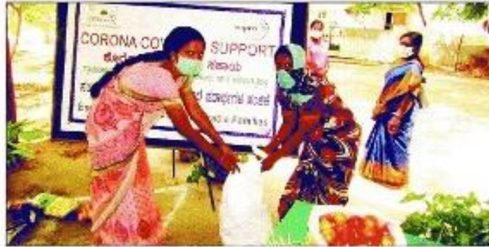
ಬೆಂಗಳೂರು ವಿಪ್ರೋ ಕಂಪನಿ, ಗ್ರಾಮವಿಕಾಸ ಸಂಸ್ಥೆ ವತಿಯಿಂದ ಮುಳುಬಾಗಲು ತಾಲೂಕಿನ ಹೊನ್ನೆಶೆಟ್ಟಿಹಳ್ಳಿಯಲ್ಲಿ ಕರೋನಾ ವಾರಿಯರ್‌ಗಳಿಗೆ ದಿನಸಿ ಕಿಟ್ ವಿತರಿಸಲಾಯಿತು.

6 ಹೊನ್ನೆಶೆಟ್ಟಿಹಳ್ಳಿ ಗ್ರಾಮದ 50 ಕುಟುಂಬಗಳಿಗೆ ಈಗಾಗಲೇ ಸಂಸ್ಥೆಯಿಂದ ಆಹಾರದ ಕಿಟ್, ತರಕಾರಿ ನೀಡಲಾಗಿದೆ. ಹುಳ್ಳಗೆ ಎನ್ನನೂ ಒದಗಿಸಲಾಗಿದೆ. ಮುಖ್ಯವಾಗಿ ಸಾಮಾಜಿಕ ಅಂತರ, ಮಾಸ್ಕ್ ಅಗತ್ಯತೆ ಕುರಿತು ಮನವರಿಕೆ ಮಾಡಿಕೊಟ್ಟು ಜನತೆ ಕಡ್ಡಾಯ ಪಾಲನೆ ಮಾಡುವಂತೆ ನಿಗಾ ವಹಿಸಲಾಗಿದೆ. ಹೆಚ್ಚಿನ ಕಾರ್ಡ್‌ನಿಂದ ಅಕ್ಕಿ ಮತ್ತು ಗೋಧಿ ಜನರಿಗೆ ಸಿಕ್ಕಿದ್ದು ದಾನಿಯೊಟ್ಟರೂ ಸಹಾ ಮತ್ತಷ್ಟು ಅಕ್ಕಿ ನೀಡಿದ್ದಾರೆ. ಓಗಾಗಿ ಗ್ರಾಮಪಂಚಾಯತಿಯಿಂದ ಆಹಾರದ ಕಿಟ್ ಮತ್ತು ಕೆಲಸ ನೀಡುವಂತೆ ಬೇವರಾಯಸಮುದ್ರ ಅಧ್ಯಕ್ಷರಿಗೆ ಜನತೆ ಮನವಿ ಸಲ್ಲಿಸಿದ್ದಾರೆ. ಜನತೆ ಬೇಡಿಕೆಯನ್ನು ತಿಳಿಸಿ ಈದೇಂಕುವ ವಿಸ್ತರಣೆ ಪರಿಶೋಧನೆ ಮುಂದಾಗಲಿ.