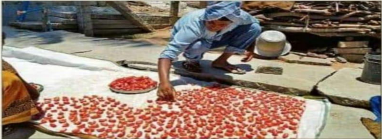
A farmer dries up tomatoes to make tomato flakes in Mulbagal, Kolar district.